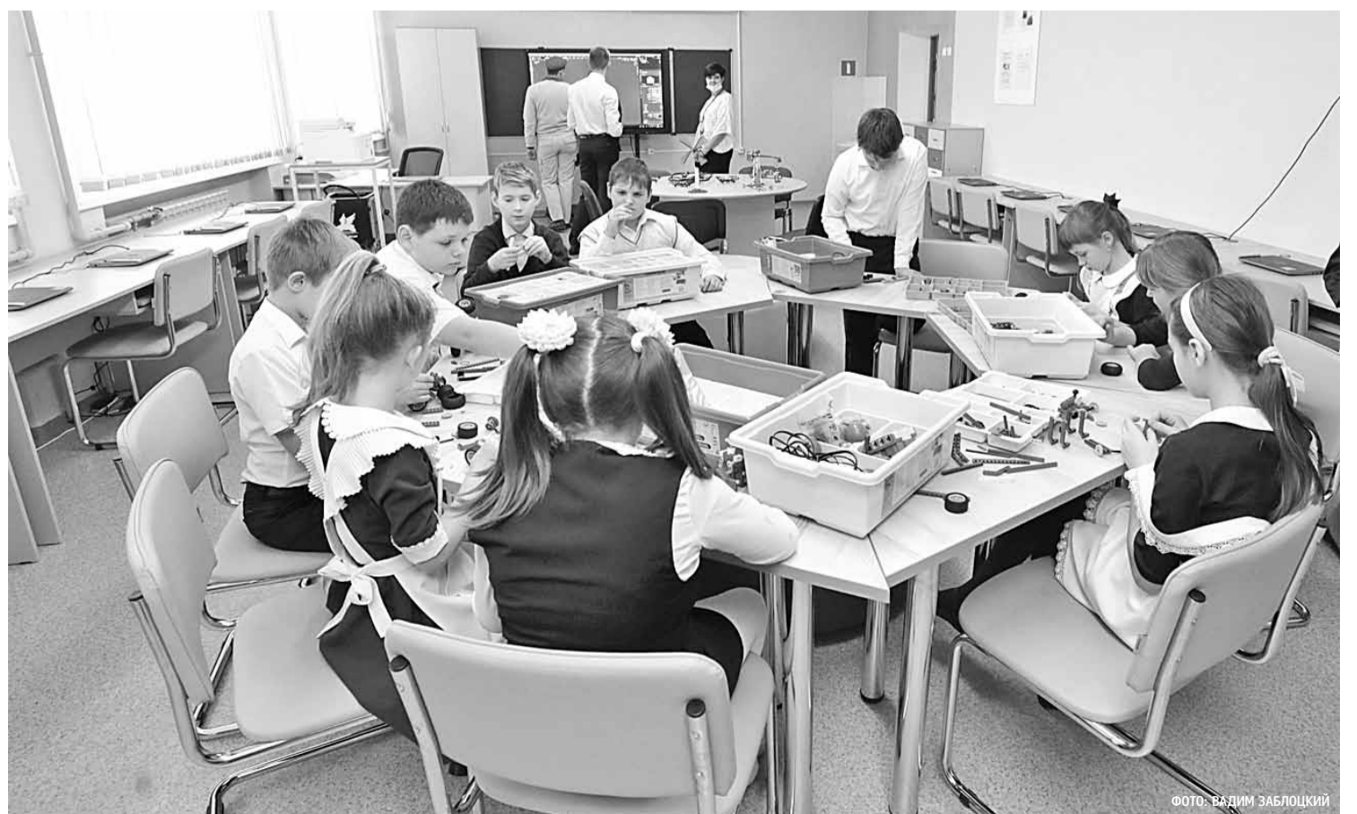
В «Точке роста» Алексеевской школы Корочанского района