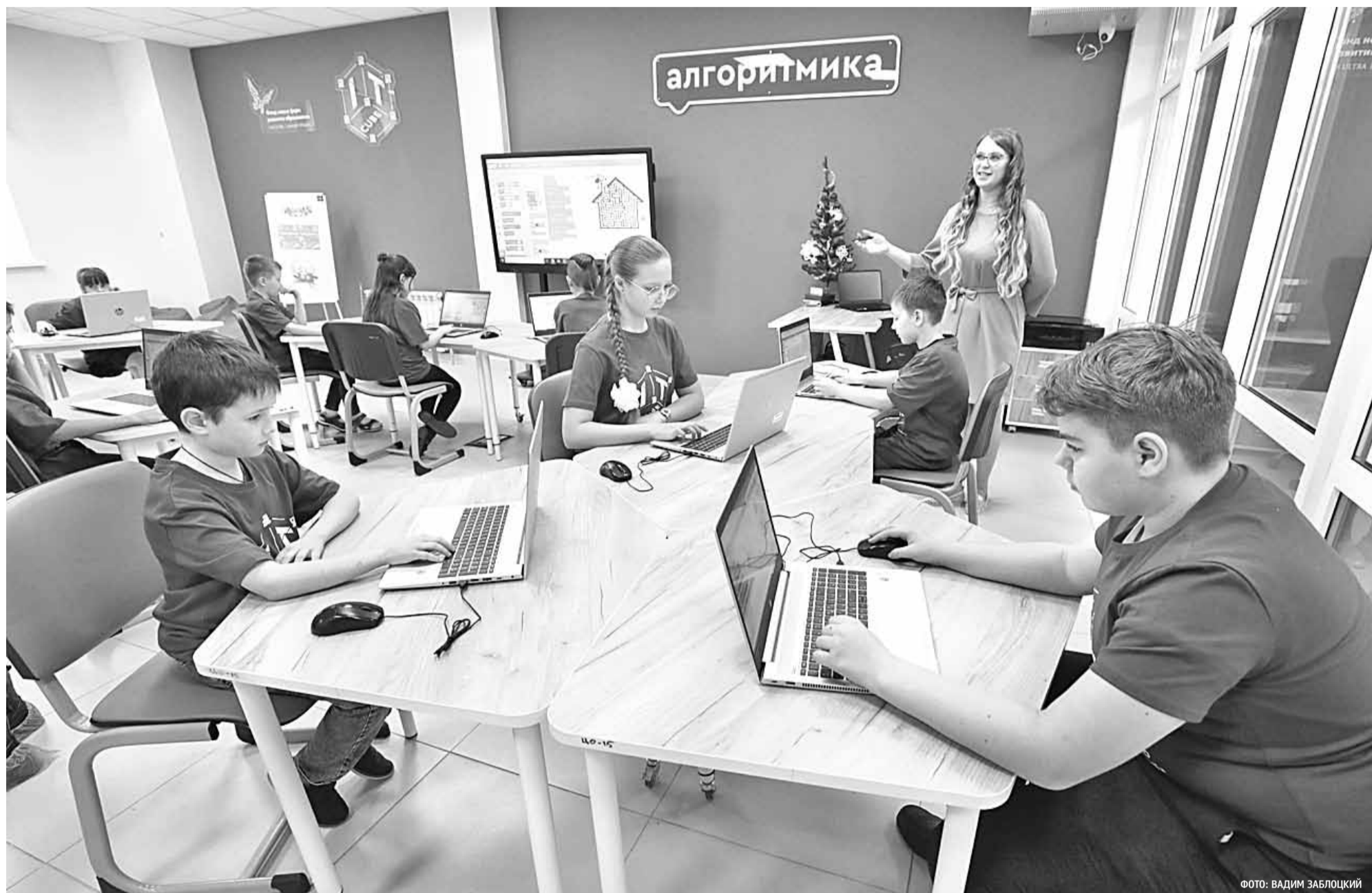
На занятии алгоритмикой в IT-кубе

КАК УПРАВЛЕНЧЕСКИЙ АСПЕКТ ОБНОВЛЕНИЯ СОДЕРЖАНИЯ ОБРАЗОВАНИЯ ПОМОЖЕТ ДОСТИЖЕНИЮ НАЦИОНАЛЬНЫХ ЦЕЛЕЙ И СТРАТЕГИЧЕСКИХ ЗАДАЧ